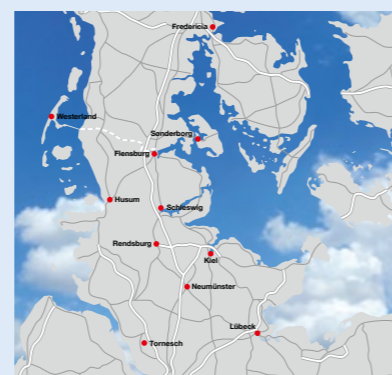
Die Filialen der Beyerdsdorf-Gruppe

Wir gewährleisten selbstverständlich auch in Zukunft, dass wir unsere Dienstleistungen – wie Sie es von uns gewohnt sind – zuverlässig und kompetent ausführen werden.